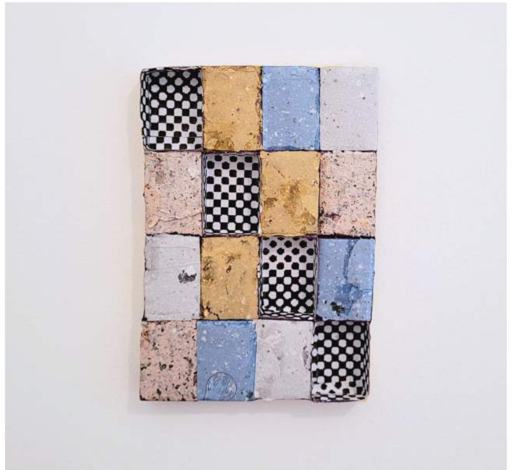
Pele de Rua 16 - "Paralelepípedo" (2024)