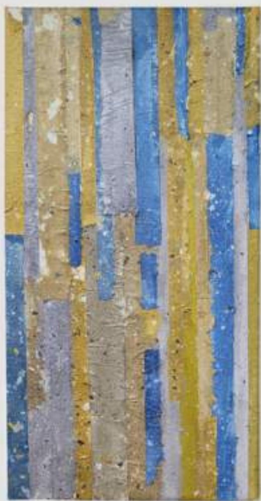
Pele de Rua 5 (2022) 20 x 40 cm Papéis reciclados e reutilizados de sobra de lambe-lambe