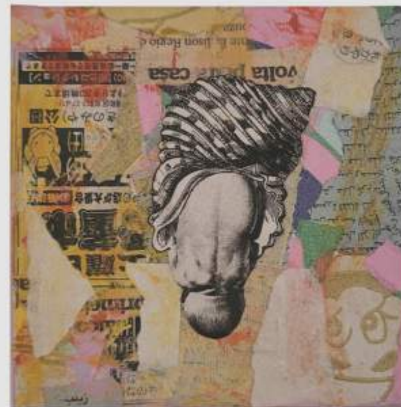
Concha 2 - Fase Verde (2020) 12 x 12 cm Assemblage sobre tela