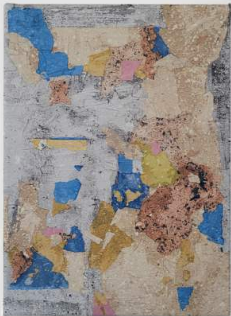
Craquelada, Pele de Rua 18 (2024)