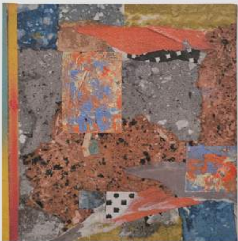
Pele de Rua 1 (2022)