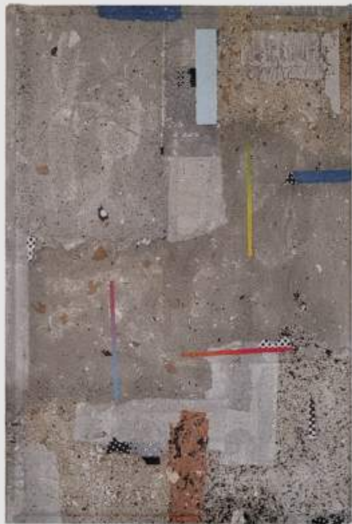
Pele de Rua 11 (2022)