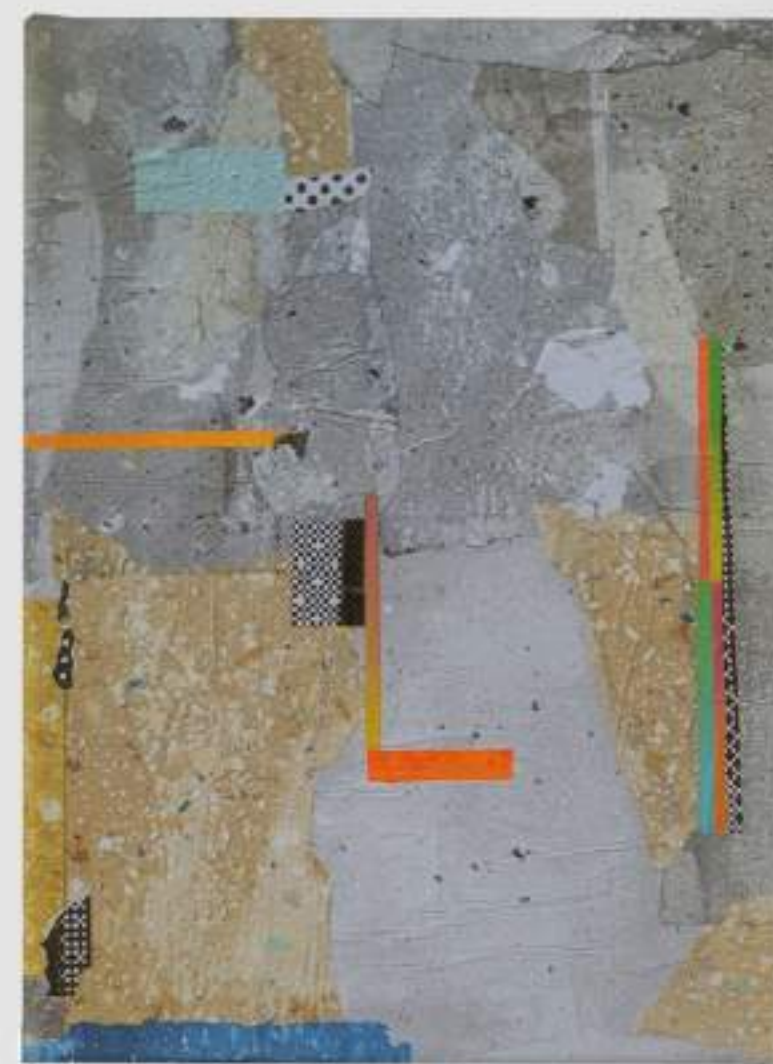
Pele de Rua 9 (2022)