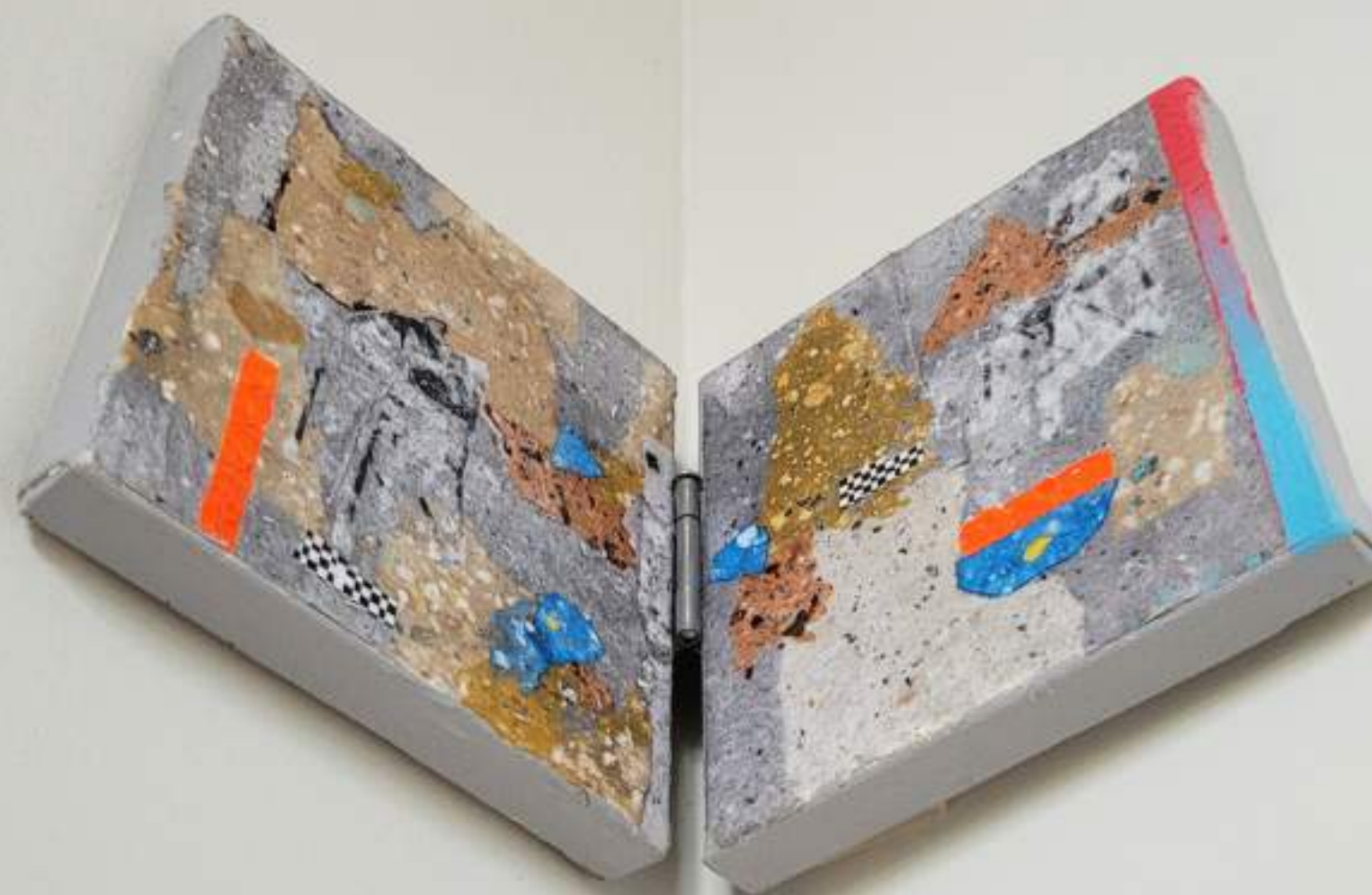
"Esquininha", Pele de Rua 6 e 7 (2022 - 2023) aprox 24 x 12 cm Papéis reciclados e reutilizados de sobra de lambe-lambe, acrílica, spray e dobradiça sobre tela