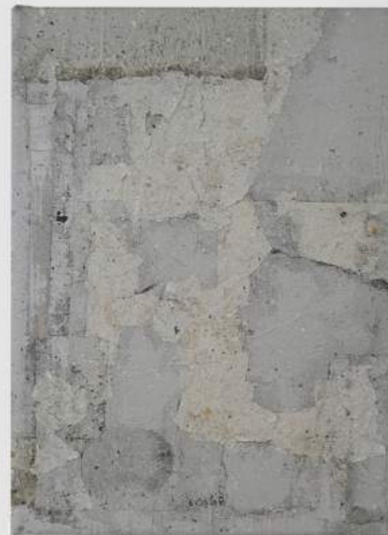
Cimentada, Pele de Rua 19 (2024)