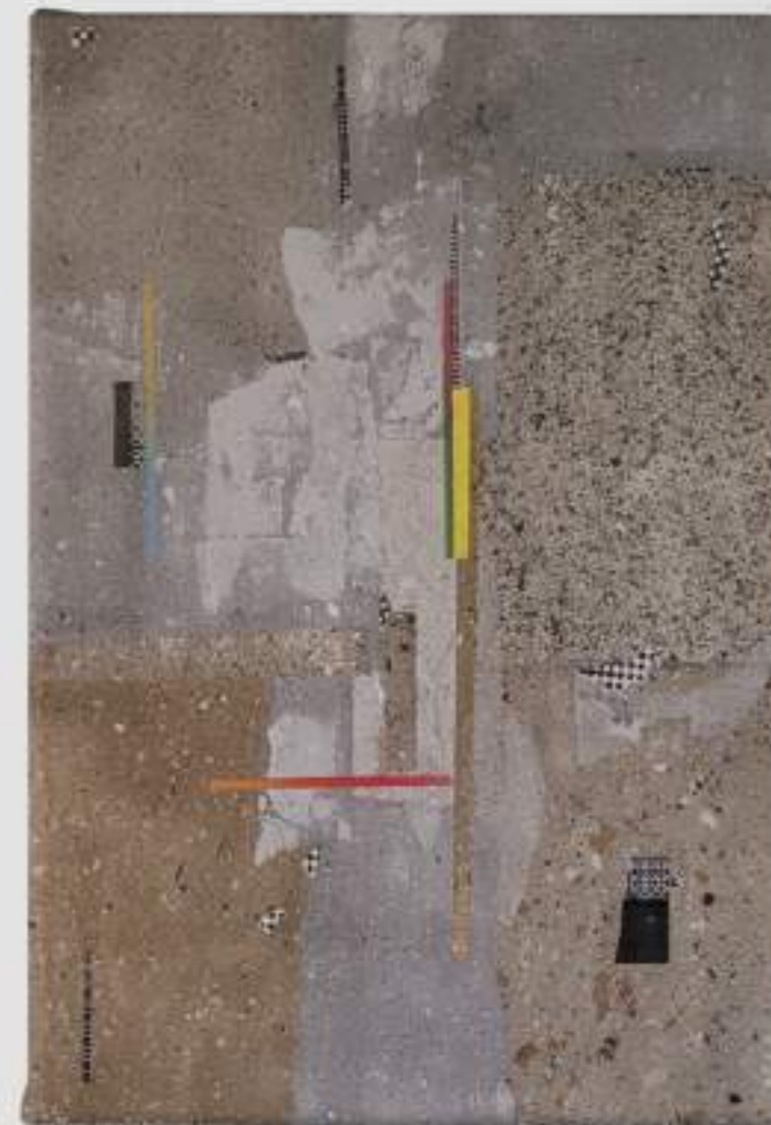
Pele de Rua 13 (2022)