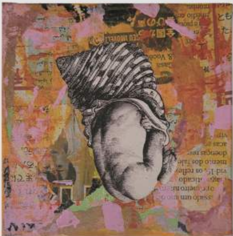
Concha 3 - Fase Laranja (2021) 12 x 12 cm Assemblage sobre tela