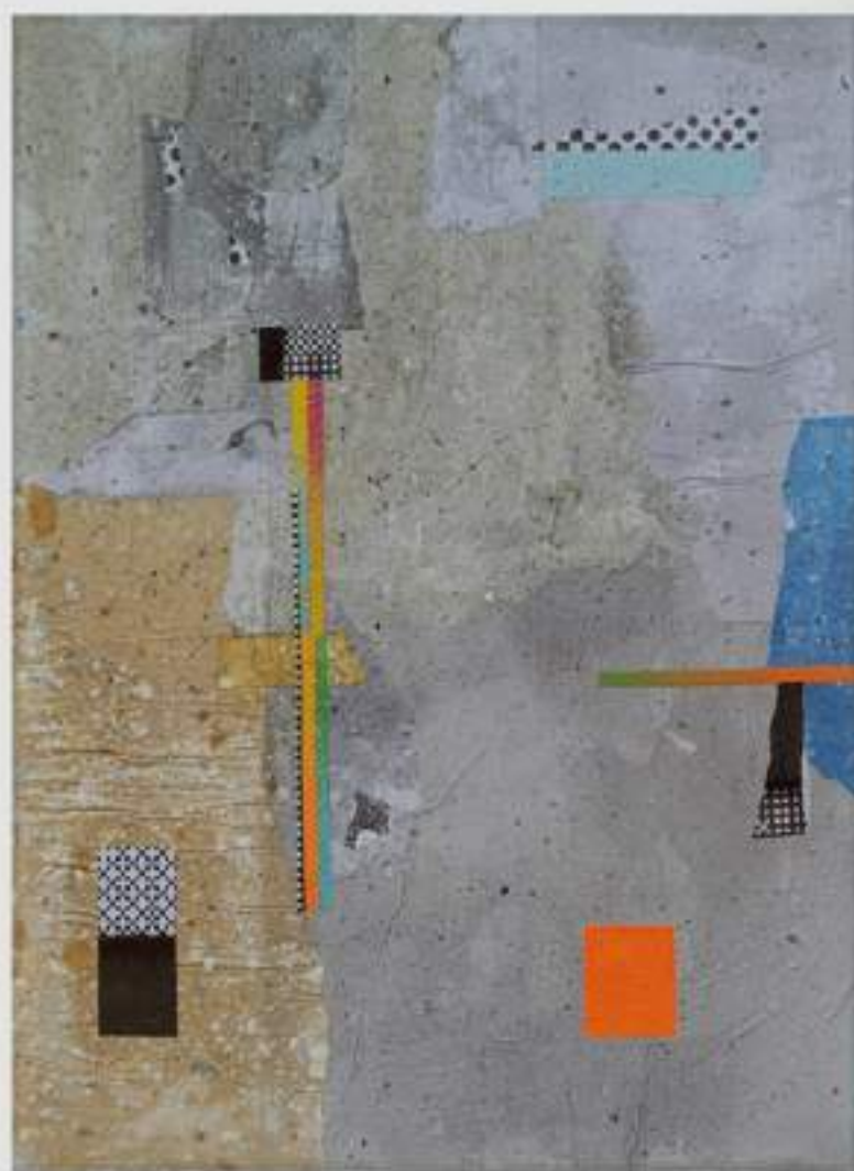
Pele de Rua 10 (2022)