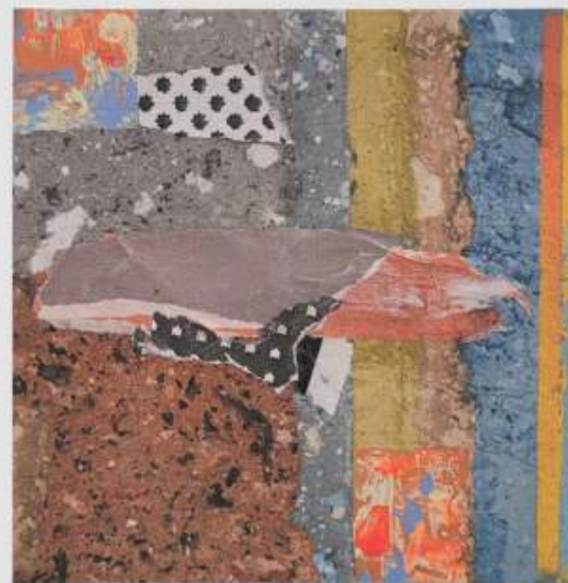
Pele de Rua 2 (2022)