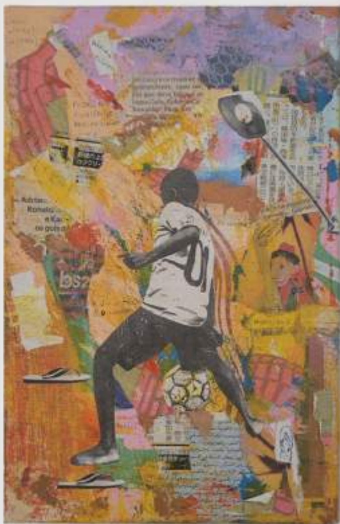
Golzinho (2020) 20 x 30 cm Assemblage sobre tela