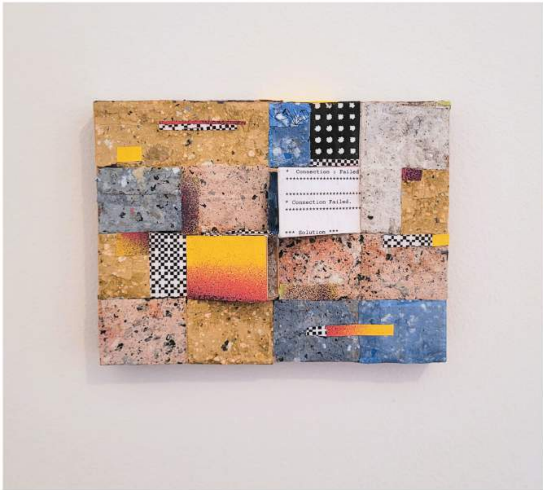
Pele de Rua 15 - "Calçadinha 2" (2024)