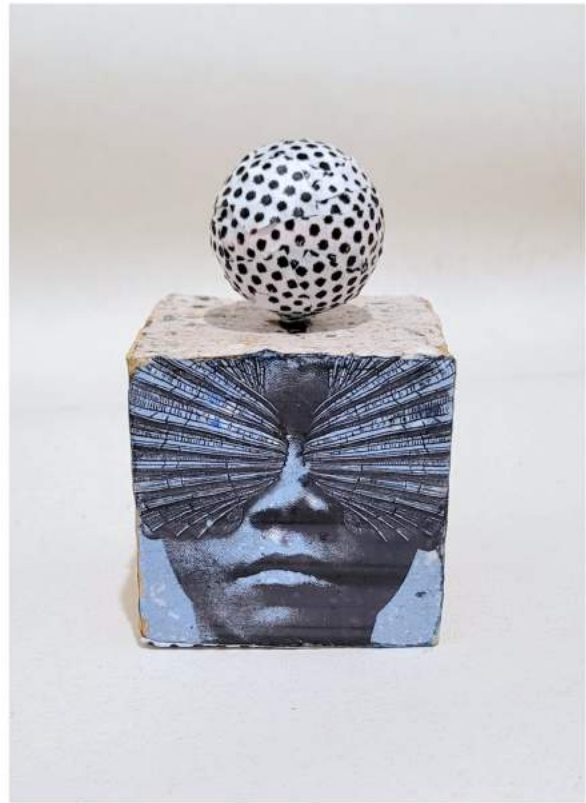
Pele de Rua 20 - "Espraiada" (2024)