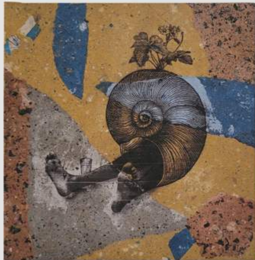
Sem título (2022) 15 x 15 cm Impressão sob papéis reciclados e reutilizados de sobra de lambe-lambe